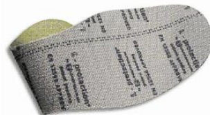
Wkładka poliester (HTP)(P).