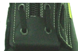
System zamykania sznurówki+zamek