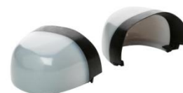
Podnosek kompozytowy Vincap®