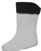
Wodoszczelna podszewka Bootie Gore-Tex®