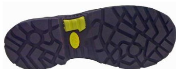
Lekka i elastyczna podeszwa gumowo-poliuretanowa, antypoślizgowa, antystatyczna, olejoodporna.