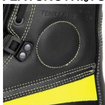
Ochrona kostki Paski odblaskowe szyte podwójnym szwem