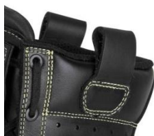
Szerokie uchwyty na bokach, oddychający język