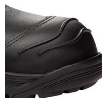
Dodatkowa ochrona gumowa na nosku