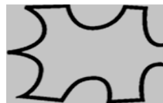
Pełna skóra licowa