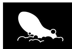
Wyjmowana wkładka z możliwością prania